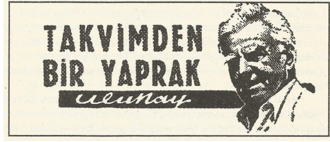
Görsel 1: Refi' Cevat Ulunay'ın Milliyet Gazetesindeki köşesi için kullanılan görsel. (Kaynak: Ulunay, (2004) “Bu Gözler Neler Gördü”)

ı elfaza feda eden bir “Nihrir” idi. Divan Edebiyatı’na oldukça vakıftı. Fransızcası iyi idi. Sahibi, veya ravisi olduğu güzel anekdotları vardı. Hoş sohbet, şakacı, sırasına göre bedzeban, sırasına göre hoş beyan bir zat idi. Ufulü Türk kalem alemi için zayıttan sayılır; çünkü artık Türkiye’de böyle yazan, hatta o yazıları anhyarak okuyan kimse kalmadı” (Ulunay, sf 61, 2004).