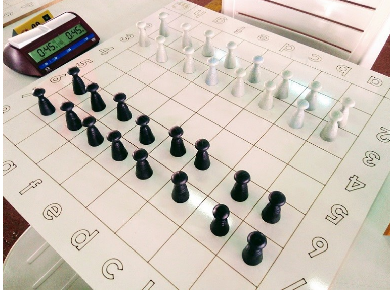
Görsel 2: Dama oyun masasının görünümü

(Mustafakemalpaşa' da 2018 yılında düzenlenen 19. dama turnuvasından )